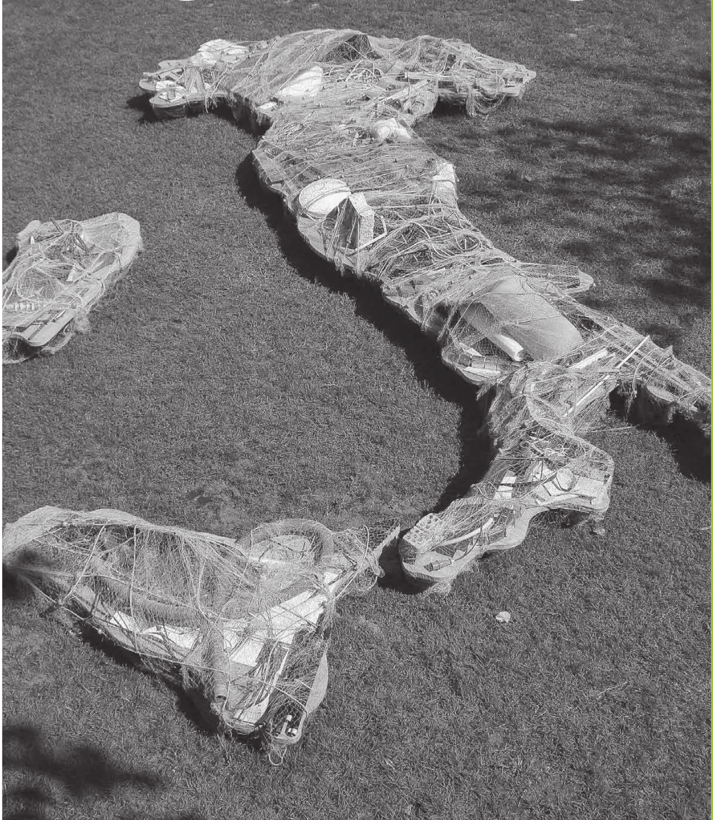
Michelangelo Pistoletto, L'Italia Riciclata , Padiglione Italia - 13. Mostra Internazionale di Architettura della Biennale di Venezia